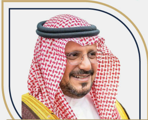
نائب أمير منطقة القصيم صاحب السمو الملكي الأمير