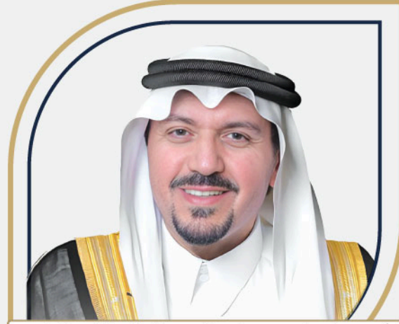
أمير منطقة القصيم صاحب السمو الملكي الأمير الدكتور

فيصل بن مشعل بن سعود بن عبدالعزيز آل سعود